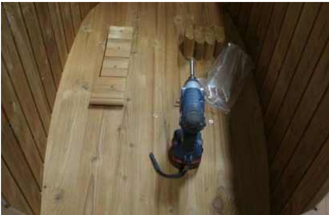
Sæde montering. Sædets støttestykker er vist på billedet i den rækkefølge, de er placeret