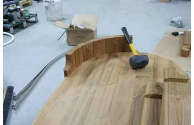
Efter fem sideplanker bruges sidestave nr.2