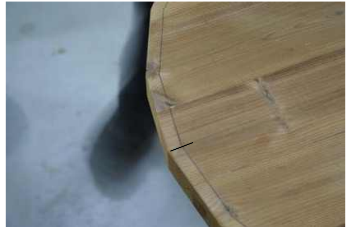
Start ved mærket med det første sidebræt. Se figur 1 på sidste side for detaljer

NOTE! Det er vigtigt, at sidebrædderne følger den markerede linje!