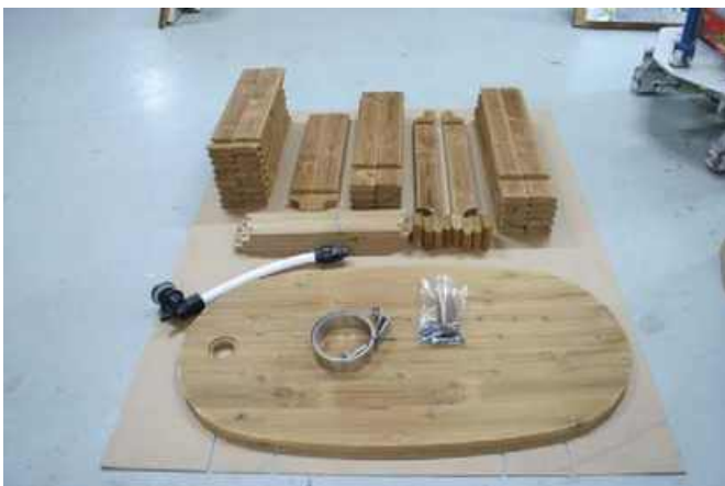
Billedet viser delene