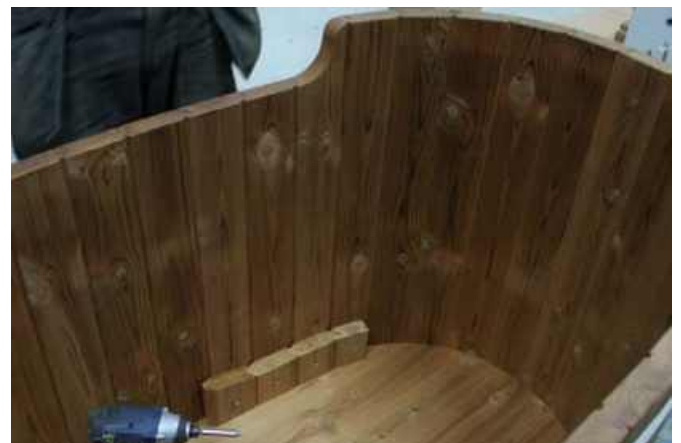
Skru alle stykkerne som vist på billedet. NOTE! Første og sidste stykke er forskellige, se billede. Gør det samme på den anden side