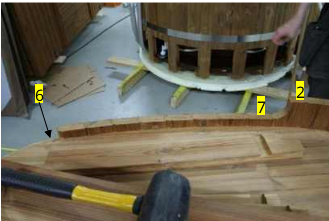
Efter otte sidebrædder fra gruppe 7 fastgøres derefter sideplade nr. 6.