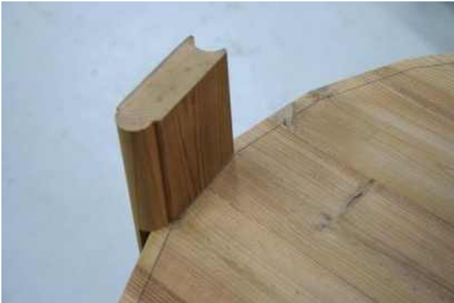
Placer den første sidestav, brug stavene i pakke 1: