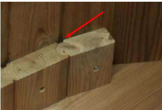
For det første støttestykke i henhold til pilen