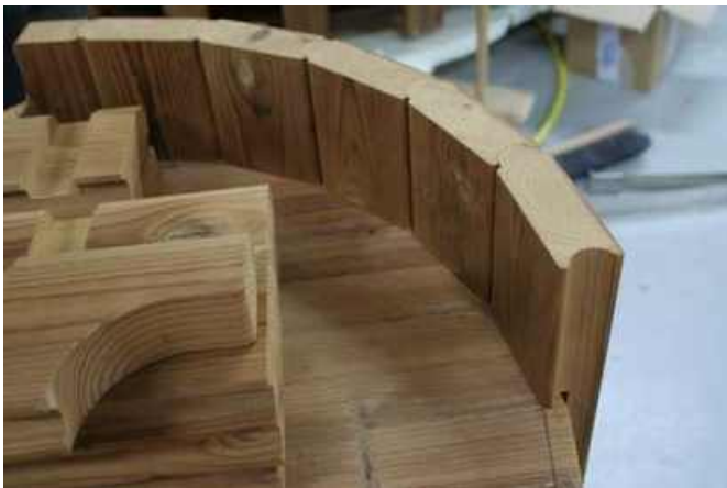
ORDENTLIGT! Sidebrædderne er lukkede på mærket!