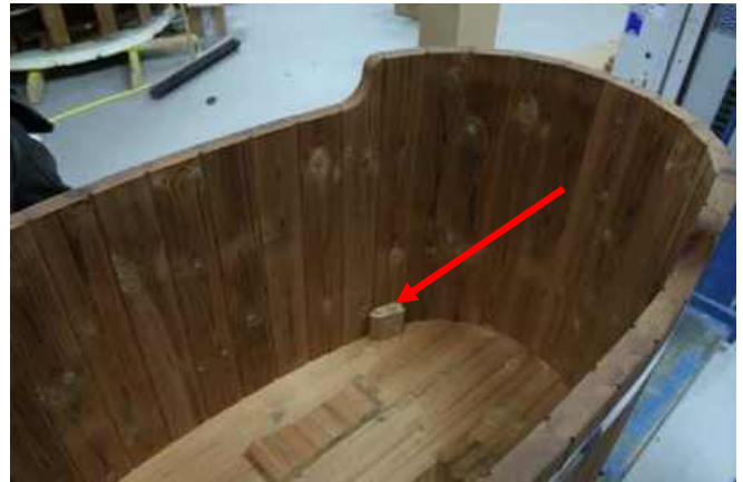
Placer det første stykke på det punkt, der er angivet af pilen på den femte stav. Se figur 2 på sidste side for detaljer.