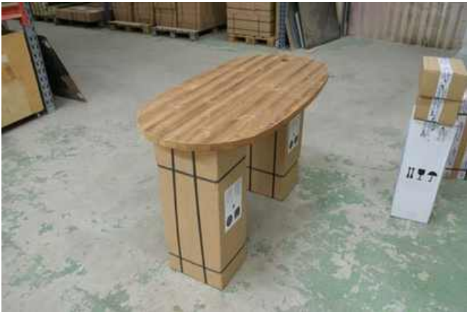
Basen placeres oven på to kasser. Installationslinje på hovedet.