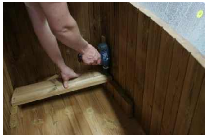
Forbor med et 3 mm bor og skru sædedelen fast med fire skruer, glem ikke at bruge de medfølgende "propper"!