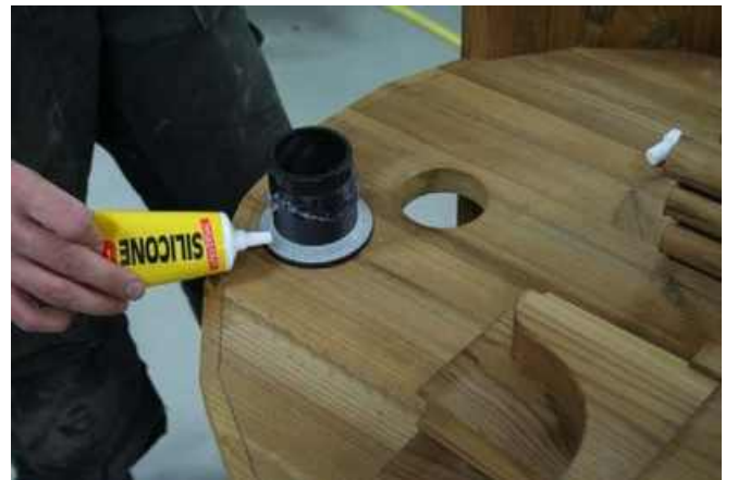
Nu er et godt tidspunkt at installere en bundventil. læg silikone på trådene.