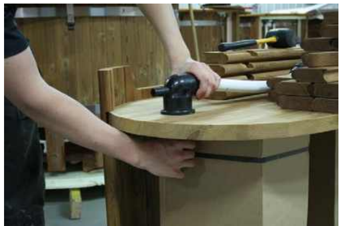
Brug det medfølgende værktøj til at stramme tyllen.