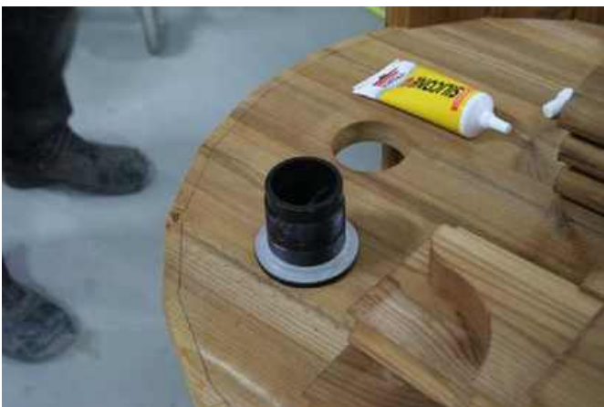
Påfør silikone på trådene med fingeren