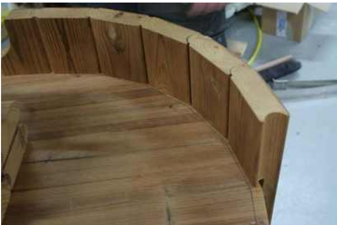
FORKERT! Sidebrædderne er ikke tæt nok på markeringslinjen, ram sidebrædderne mere indeni.

NOTE! Det er vigtigt, at sidebrædderne følger den markerede linje!