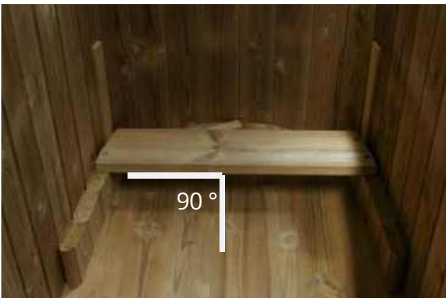
Placer nu den første sædedel, de medfølgende "kalibreringsstykker" hjælper med at placere sædet korrekt. Kontroller, at den forreste del er i en vinkel på 90 grader i forhold til basen.