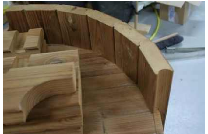
FORKERT! Skænkene krydser mærket!